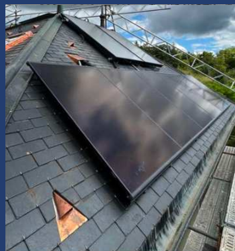
Technique en toiture