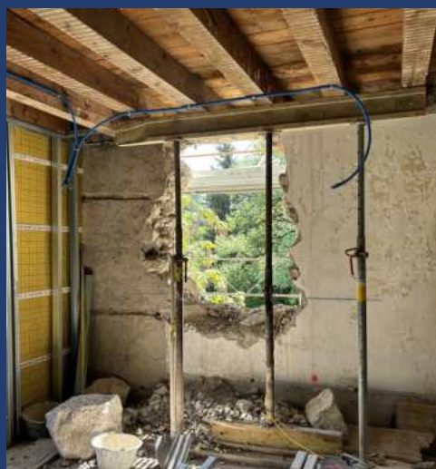
Ouvertures en façade