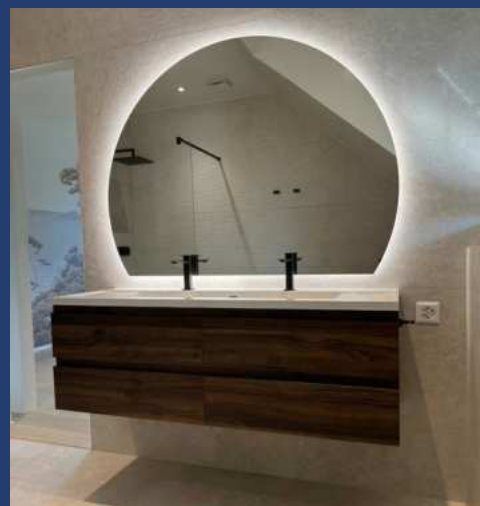
Design et lumière