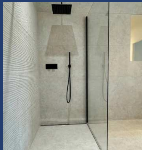
Douche à l'italienne